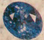
Sold at US $ 66000 SAPPHIRE FACETED 1 PC. 10.00 Cts.