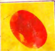
Sold at US$. 240001