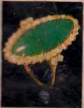
ဝန်းချီ တဂိုးပျို