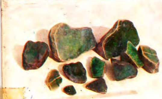
jade Sold at US$. 40003