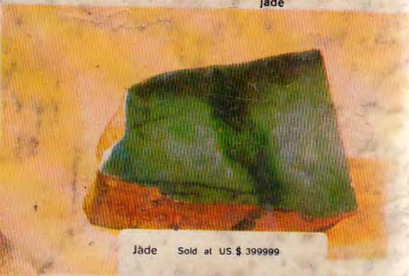
Jade Sold at US $ 399999